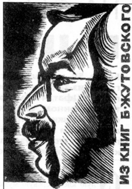
Экслибрис Б. Жutowского