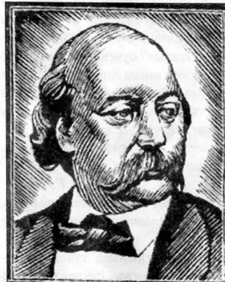
Портрет О. де Бальзака