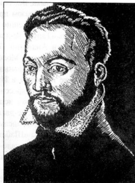
Портрет Б. Спинозы